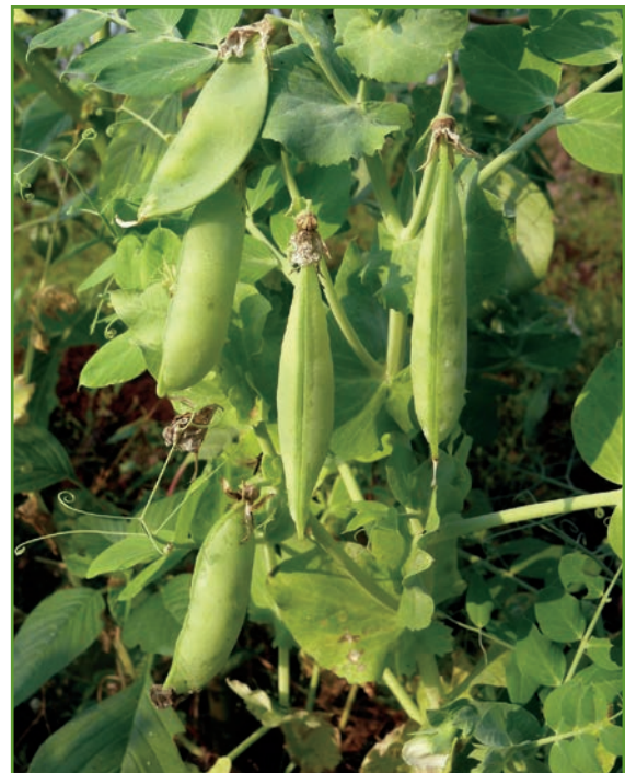
Figura 1. La mayoría de las variedades cultivadas son trepadoras y necesitan una espaldera como soport.