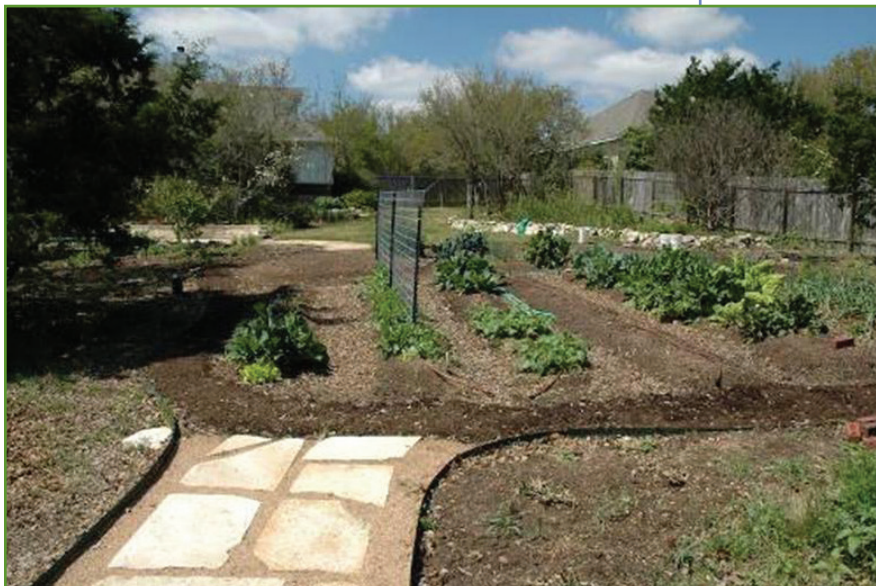
Figura 1. Un huerto exitoso empieza con un buen diseño.

No siembre vegetales debajo de ramas grandes de árboles o cerca de arbustos ya que estos le robarán agua y nutrientes a las plantas.