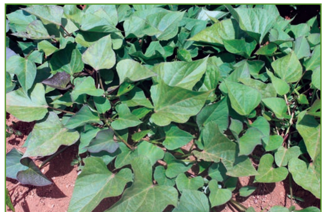
Figura 1. Vides de hoja de la planta de la patata dulce.

Los días calurosos y las noches cálidas son ideales para la producción, por lo que