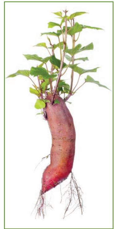
Figura 3. Comote produciendo esquejes.